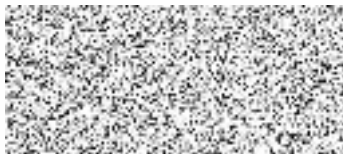
vedoucí odboru dopravy

Společné povolení pozbývá platnosti, jestliže stavba nebyla zahájena v době jeho platnosti. Společné povolení pozbývá platnosti též dnem, kdy stavební úřad obdrží oznámení stavebníka o tom, že od provedení svého stavebního záměru upouští; to neplatí, jestliže stavba již byla zahájena.